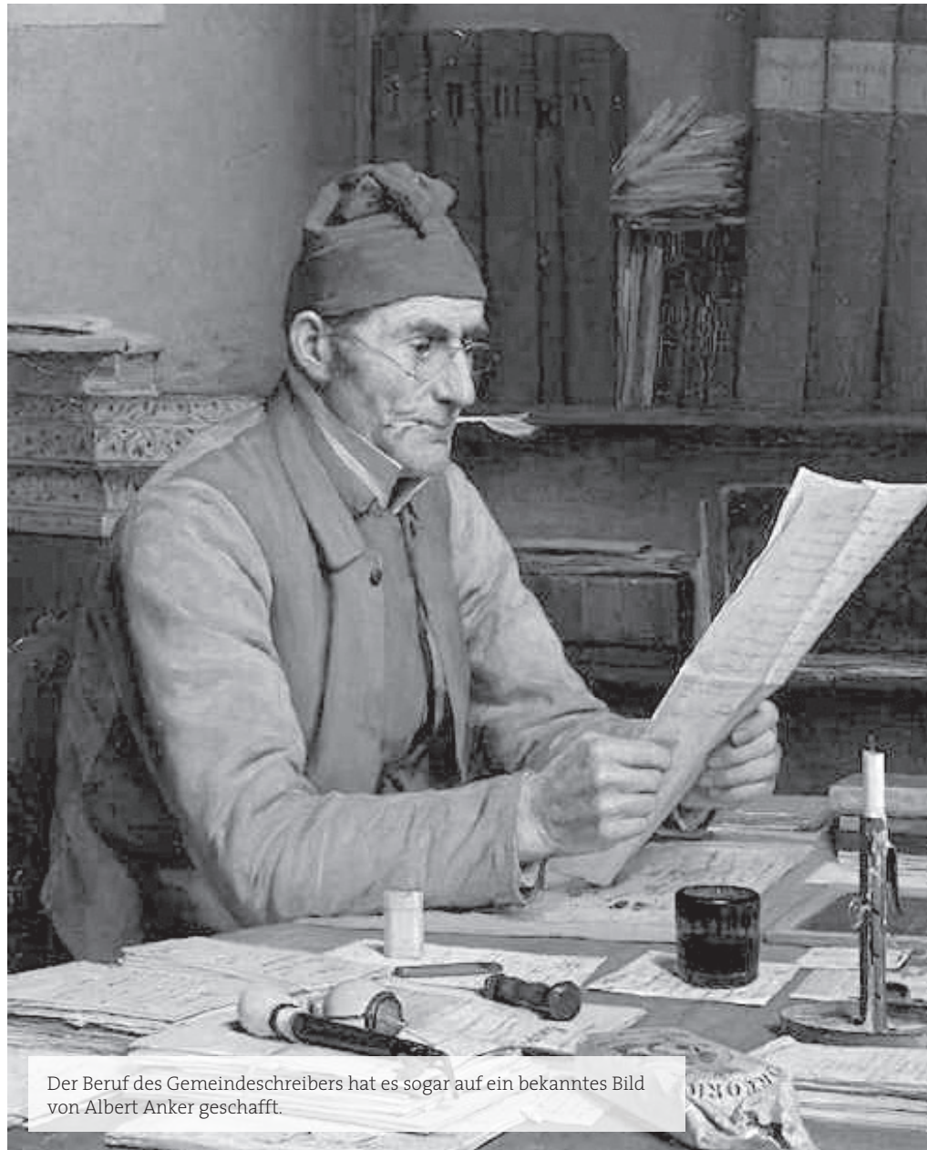
Der Beruf des Gemeindeschreibers hat es sogar auf ein bekanntes Bild von Albert Anker geschafft.

Die Aufgaben einer Gemeindeschreiberin sind vielfältig und abwechslungs-