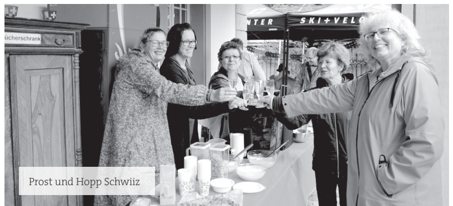
Prost und Hopp Schwiiz