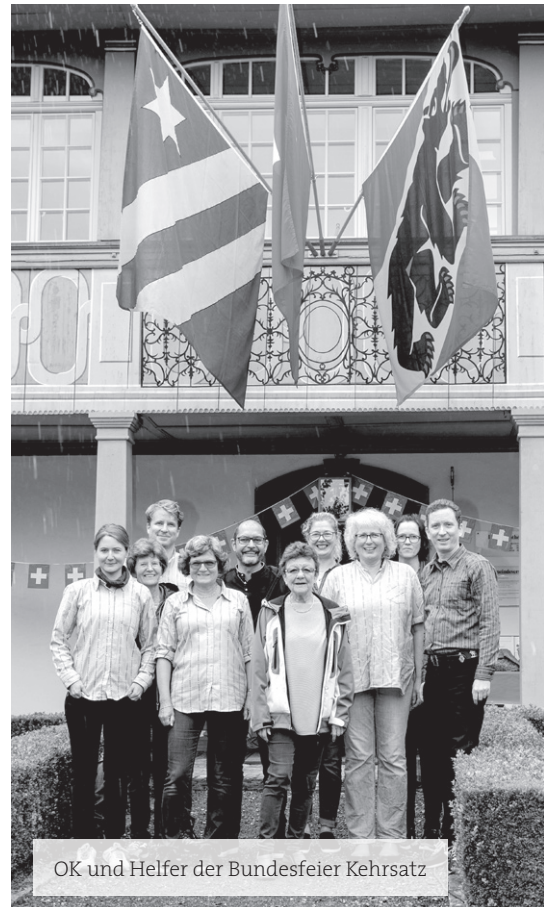
OK und Helfer der Bundesfeier Kehrsatz