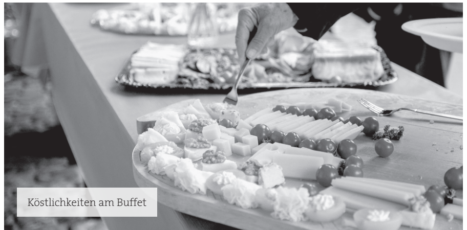
Köstlichkeiten am Buffet

A. Bill AG, Kehrsatz / archivsuisse AG, Kehrsatz / Bistro Weidli / Fly Worker, Kehrsatz / Blumen Maurer, Kehrsatz / Dentalpraxis Diserens, Kehrsatz / Ehemaliger Gurtenleist / Jutzi Motorsport, Walkringen / Kilchenmann AG, Kehrsatz / Kyburz Bettwarenfabrik AG, Kehrsatz / Ski+Velo-Center, Niederwangen / Valiant Bank, Kehrsatz / Werder + Partner AG, Kehrsatz / Gemeinde Kehrsatz / Frauenverein Kehrsatz / Dorfverein Kehrsatz / Redaktion Chäsitzer